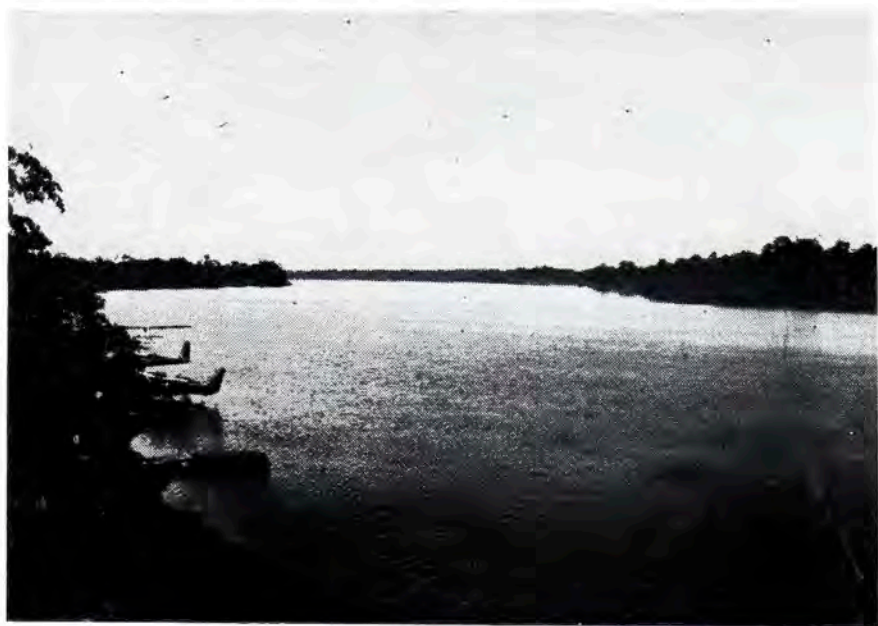
Vista al norte del lago Yarinacocha desde la base del Instituto Lingüístico de Verano.